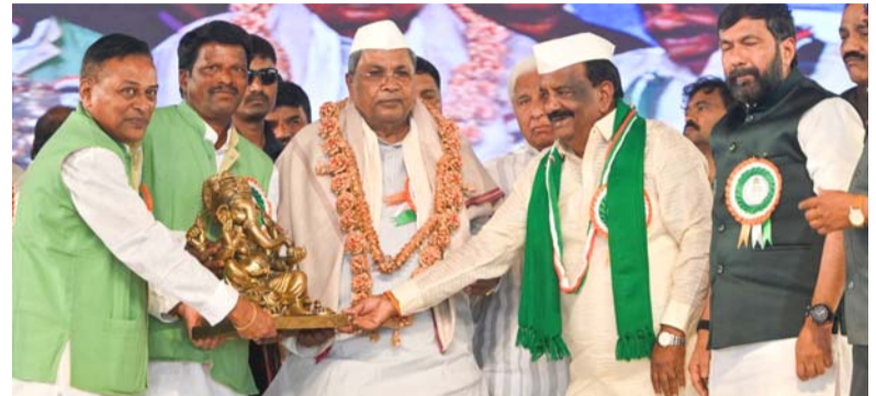
ಸಂಬಂಧಿಸಿದಂತೆ ಕೇಂದ್ರ ಪರಿಸರ ಇಲಾಖೆ ಯಿಂದ ಇಂದಿಗೂ ಅನುಮತಿ ಸಿಕ್ಕಿಲ್ಲ. ಅನುಮತಿ ದೊರೆತರೆ ನಾವು ನಾಳೆಯಿಂದಲೇ ಯೋಜನೆಯ ಕಾಮಗಾರಿ ಆರಂಭಿಸಲು ಸಿದ್ಧರಿದ್ದೇವೆ. ಆದರೆ, ಇದೂ ಕೂಡ ಆಗುತ್ತಿಲ್ಲ ಎಂದು.

ಶಿರಗುಪ್ಪಿಯಲ್ಲಿ ನಡೆದ ಬೆಳ್ಳೆಹಳ್ಳಿ ಪ್ರವಾಹ ನಿಯಂತ್ರಣ ತಡೆ ಕಾಮಗಾರಿ ಶಂಕುಸ್ಥಾಪನೆ, ನವಲಗುಂದ ಕ್ಷೇತ್ರದ ವಿವಿಧ ಅಭಿವೃದ್ಧಿ ಕಾಮಗಾರಿಗಳ ಭೂಮಿಪೂಜೆ ನೆರವೇರಿಸಿ ಅವರು ಮಾತನಾಡಿದರು.